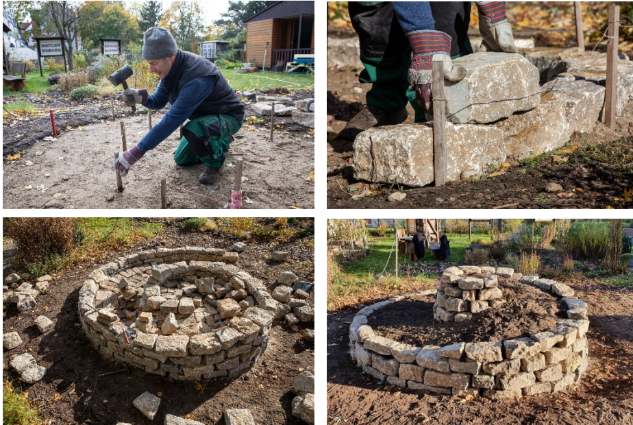
Eine Kräuterspirale entsteht im Wildbienenschauergarten Schöneweide (Berlin).